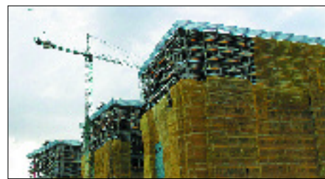
Algunhas licencias de obra tardan anos en concederse.

A cidadanía de Ribeira sabe da falla de ideas e iniciativas deste Goberno pero neste caso chegan descaradamente ó plaxio... en fin, a ver se polo menos son quen de levalas a cabo. Por certo, se queren ideas, temos moitas máis.