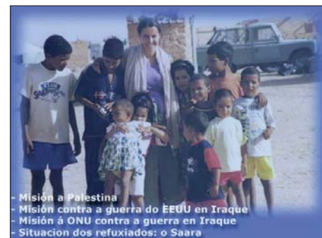
- Misión a Palestina - Misión contra a guerra do EEUU en Iraque - Misión á ONU contra a guerra en Iraque - Situación dos refuxiados: o Saara