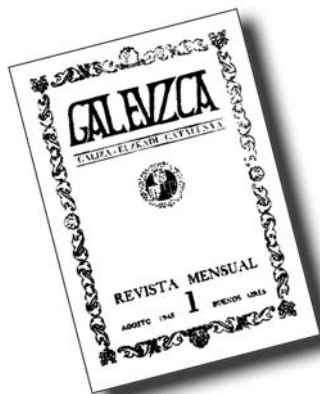
Revista Galeuzca, editada en Bos Aires en 1945.

A Declaración de Barcelona que asinaron os nacionalistas galegos, bascos e cataláns en 1998 supón un relanzamento das teses de Galeuzca e o seu meirande resultado dáse agora con esta alianza de pobos de Europa cara as vindeiras eleccións ao Parlamento da UE.