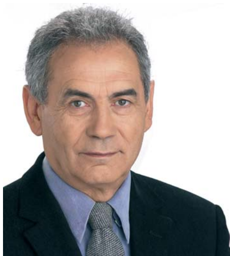
Camilo Nogueira, candidato polo BNG ao Parlamento Europeo

NACIÓN EUROPEA Temos dereito a participar, en pé de igualdade, nos órganos de decisión da UE. A nosa lingua e máis a nosa cultura non son inferiores e nós esiximos o seu pleno recoñecemento nos textos da Constitución Europea. Queremos falar galego en Europa. Os galegos debemos estar en Europa para rexeitar democraticamente as políticas antisociais, que inciden negativamente no desenvolvemento de Galiza. Imos aló a protexer os nosos sectores produtivos, o medio ambiente, a paz. Apostamos pola implantación dun modelo económico e social baseado no desenvolvemento sustentábel.